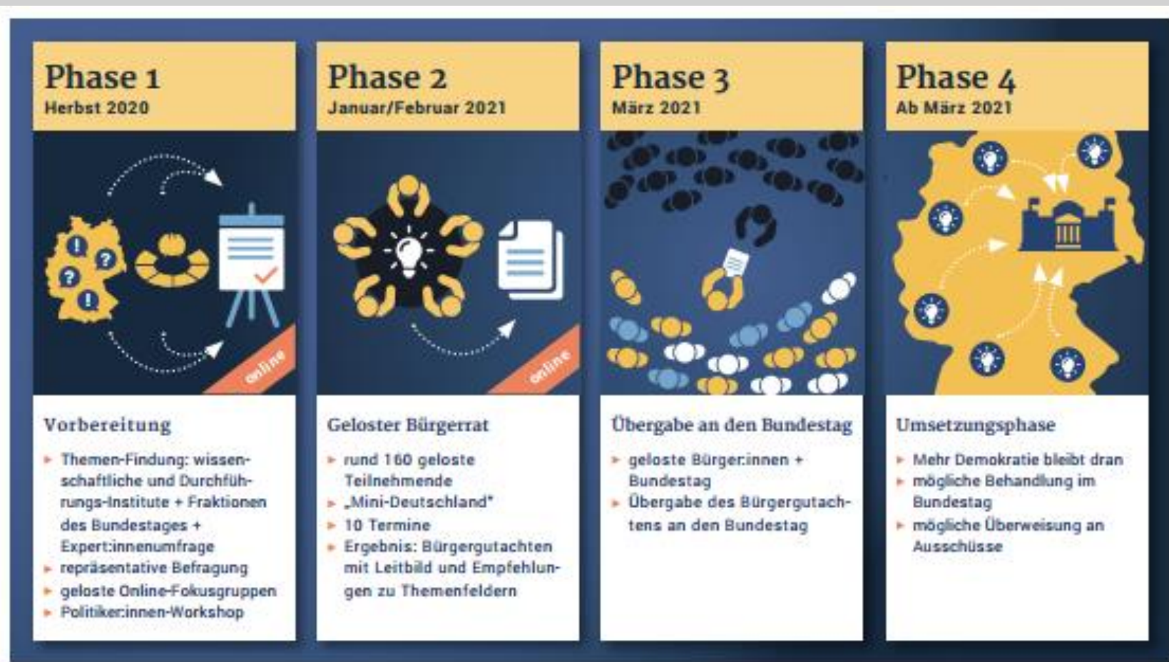
Gesamtprozess Bürgerrat Deutschlands Rolle in der Welt